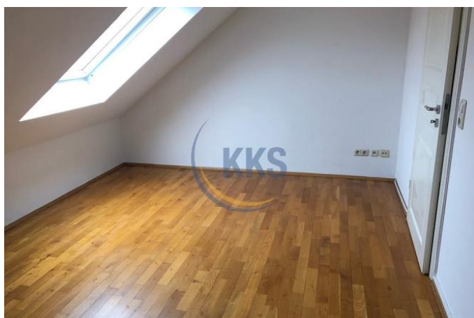
Referenz obere Etage